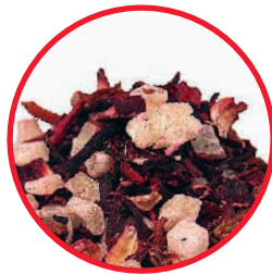
Nr. 1482 Piña Colada

«Pink Grapefruit: einfach lecker!!» (Facebook-Kommentar vom 01.06.16)