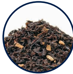
Nr. 946 Karl-Heinz, der Herbsttee

«Sehr gute Qualität, fruchtig für warme Tage besonders erfrischend.» (Bewertung vom 30.01.16)