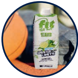
FIT FOR FUN Ice Tea

«Limette - mega lecker!» (Facebook-Kommentar vom 01.06.16)