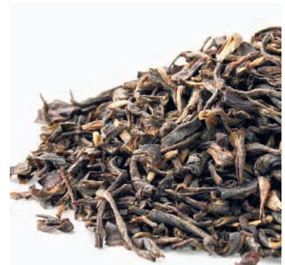
China Yellow Dragon Nr. 541

Gelber Tee kann mehrfach aufgegossen werden!